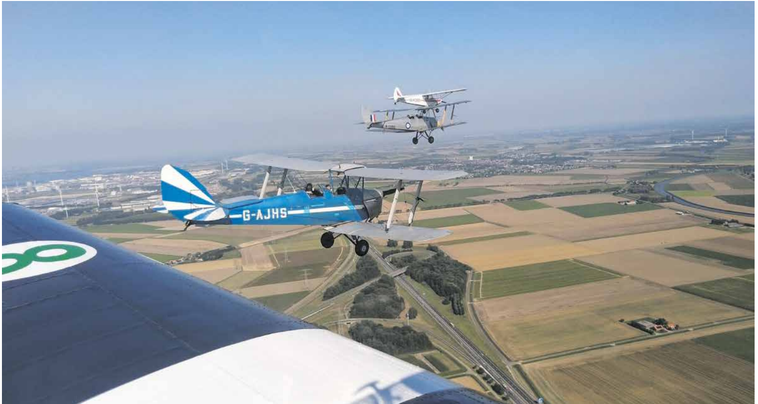
Vliegend Museum Seppe

Op zaterdag 16 september voert Vliegend Museum Seppe een Memorial Flight uit, waarbij een formatie van historische vliegtuigen verschillende crashlocaties bij Fijnaart, Nieuwemolen en Heijningen passeert.