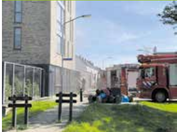
Grote brand bij Bellefleur Pagina 4