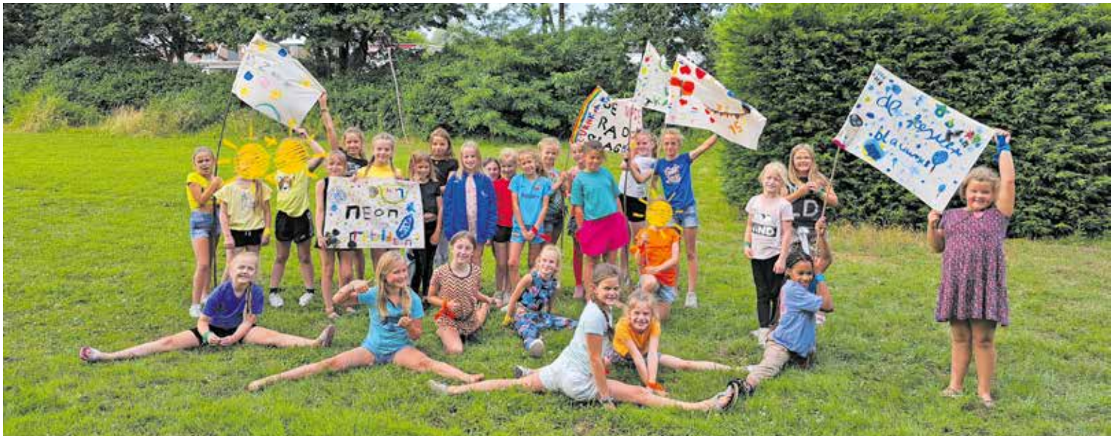
De kinderen hadden het prima naar de zin op het turnkamp.

“Ons doel was en is om iedereen actief bezig te laten zijn”