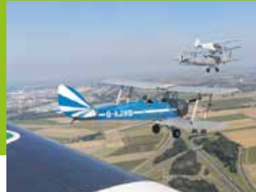
Herdenkingsvlucht met historische vliegtuigen Pagina 6