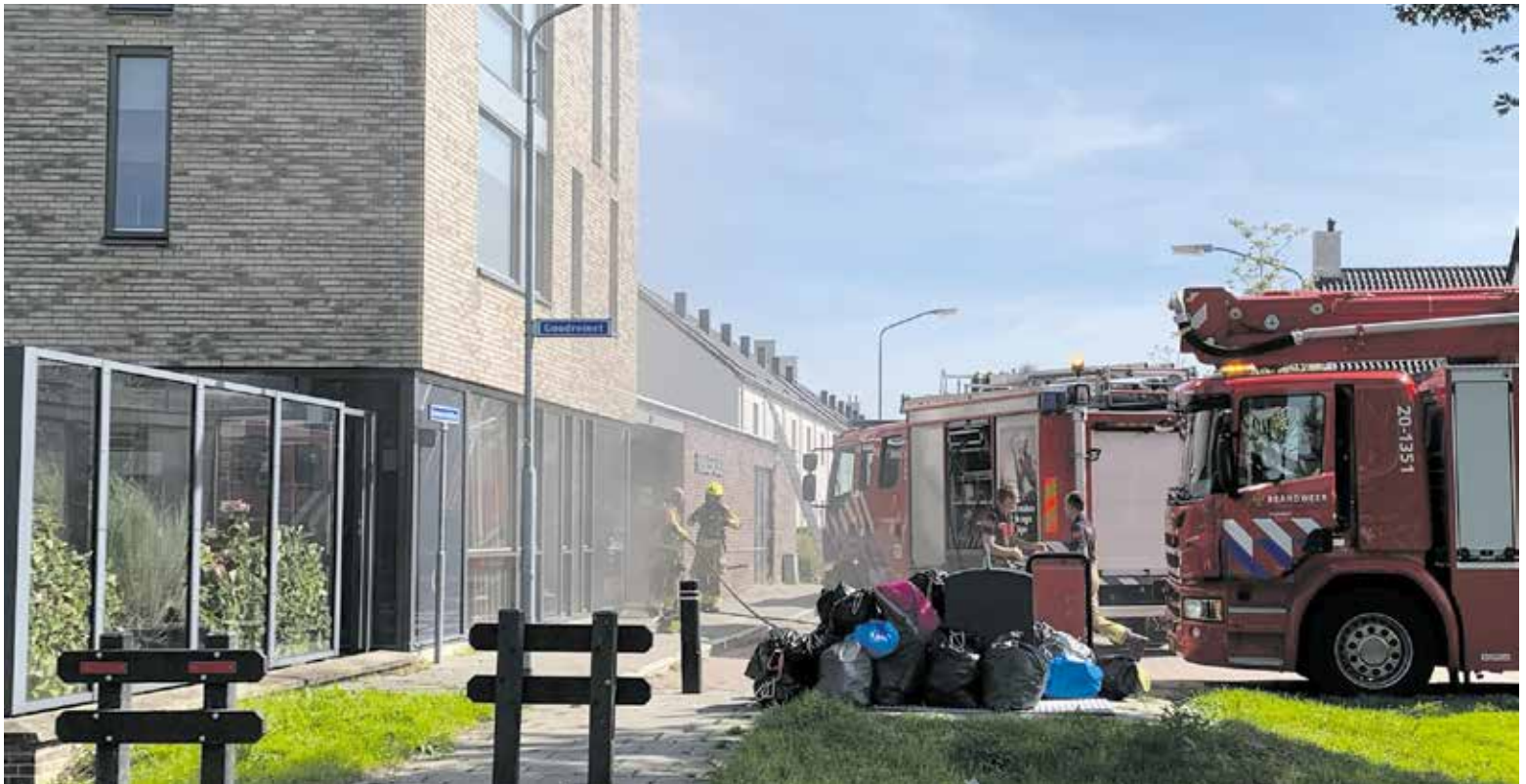
Brand bij Bellefleur in Fijnaart.

Was dat even schrikken op maandag 4 september, voor de tweede keer was er brand in de Bellefleur; eerst waren het papiercontainers die in brand gestoken waren en nu was er een koelkast in brand gevlogen.