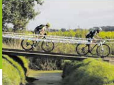
Van Der Horst Cyclocross Fijnaart Pagina 5