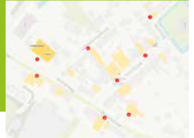
Passantentellingen vitale centra Pagina 7