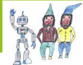
Polleke en Pelleke bij BOM Engineering