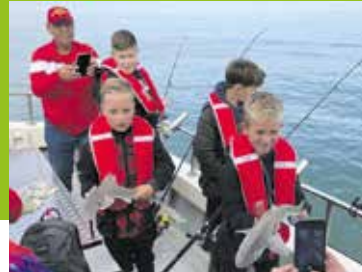
Jeugdleden 't Schietertje vissen op Haaien