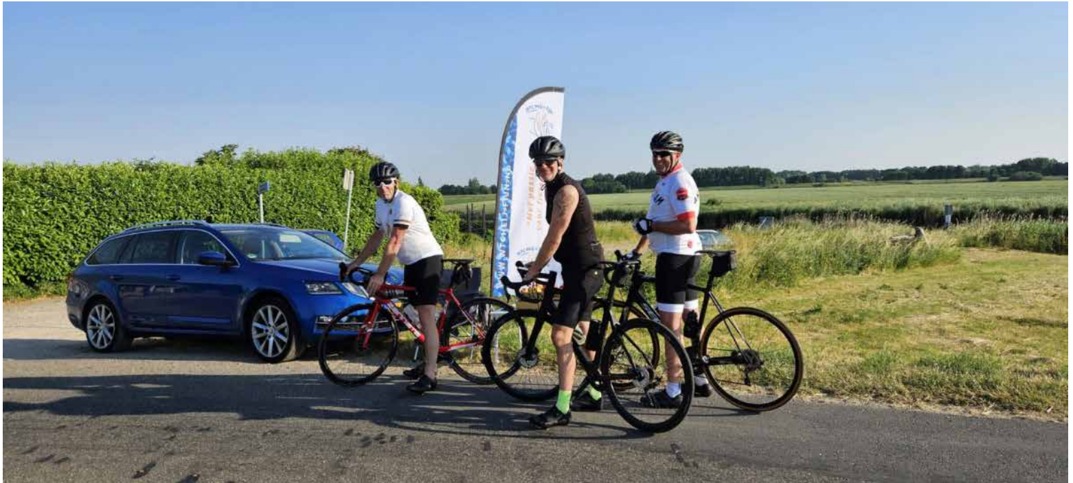
Even op adem komen bij de stempelpost 40km / WTC Heij=Fijn

Afgelopen week vond de vijfde Fijnaartse Fiets4daagse plaats. Vier avonden genoten 142 deelnemers onder bijna tropische weersomstandigheden van verschillende routes door de mooie West-Brabantse polders rondom Fijnaart.