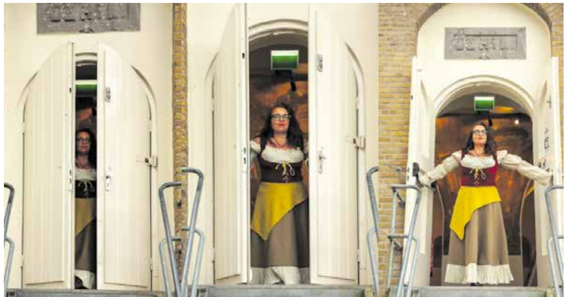
Fort de Hel is weer open