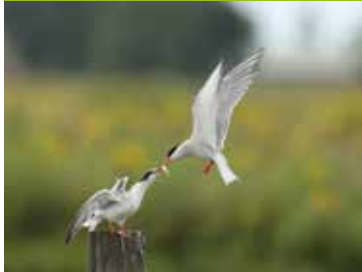
Visdiefje Pagina 4