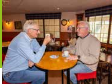
De kracht van verbinding Pagina 7