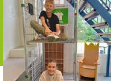
Schoolnieuws Pagina 12