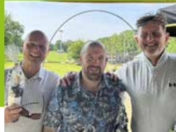
Golfmannen Pagina 10