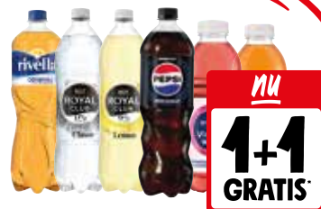
Pepsi, Royal Club, Rivella of Sourcy Alle flessen à 1 liter