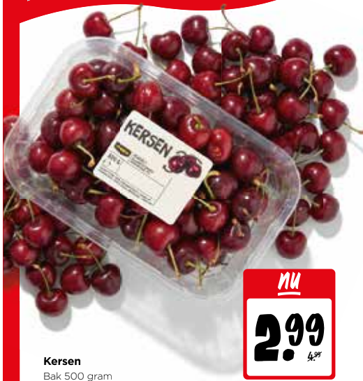
Kersen Bak 500 gram

PRIJZENSTORM AANBIEDINGEN DIE ZO DE WINKEL UITVLIEGEN