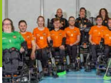
WK powerchair hockey