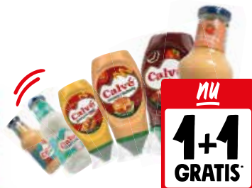
Calvé sauzen Alle flessen à 250-320 ml