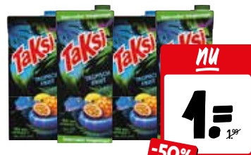
Taksi Alle pakken à 1,5 liter, per pak