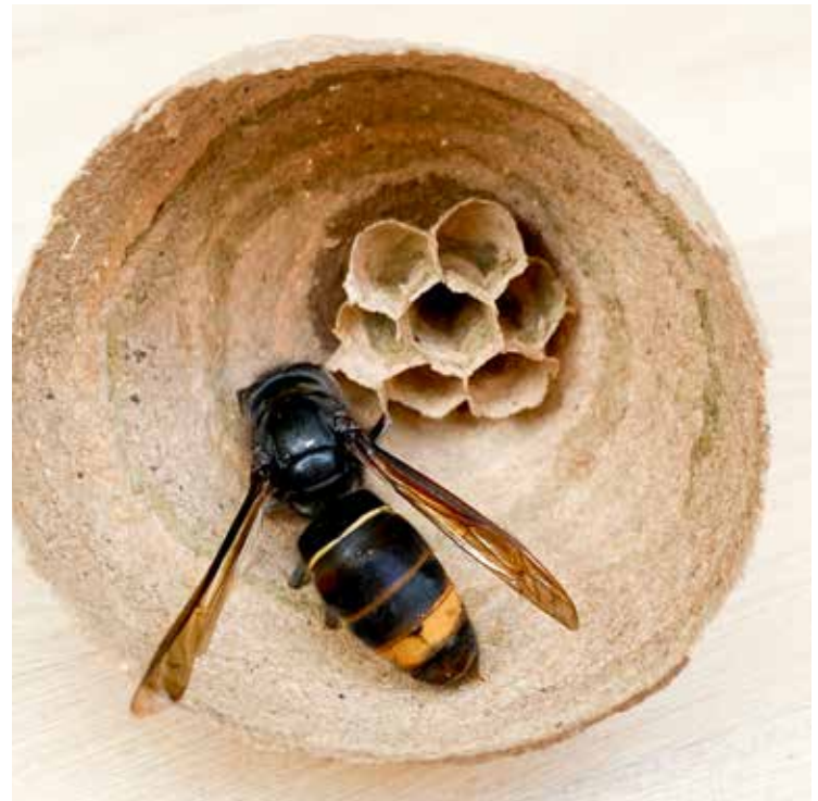
Embryonestje met koningin

De aanpak verschuift nu steeds meer van het vangen van koninginnen naar het opsporen van primaire nesten. Hiervoor worden zogenoemde 'wiekpotten' gebruikt. Dit zijn glazen potten met een niet-giftig lokmiddel. Wanneer een