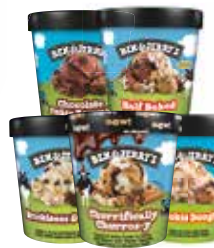
Ben & Jerry's Alle bekertjes à 427-465 ml