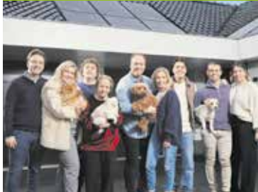
Real life soap de Bauers