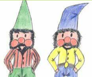
Polleke en Pelleke