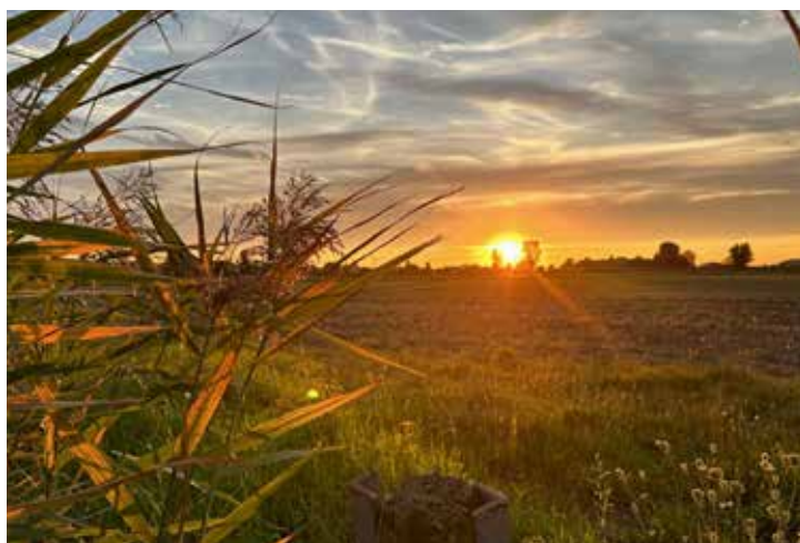
Zonsondergang - Jan Gorter

Lever je foto's in via www.fijnaartlokaal.nl/fotos-aanleveren en kom ook in de galerij van Fijnaart in Beeld.