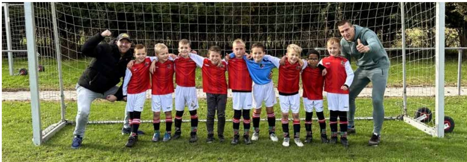
De Fendert JO8-1 kampioen 1e periode 2023-2024

Afgelopen zaterdag is de JO8-1 in de kantine gehuldigd voor het behalen van het kampioenschap van de 1e fase van het lopende seizoen. Namens het jeugdbestuur hebben we deze toppers in het