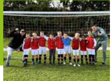
Nog een kampioen