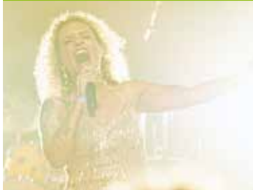
Een avondje nostalgie