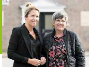
Een licht op herinnering