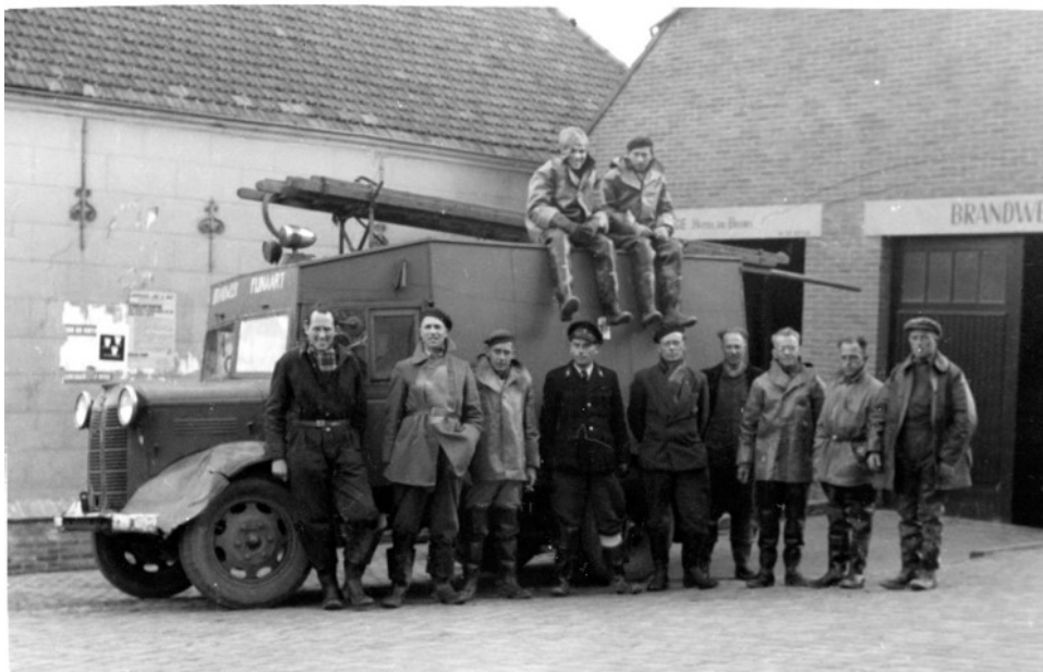
Het Korps Vrijwillige Brandweer Fijnaart

Zoals gevraagd in het artikel van Fijnaart Lokaal nr 28 ben ik op zoek naar fotomateriaal, anekdotes, aandenkens en overig materiaal uit het leven en de periode van vader Minus de Reijer.