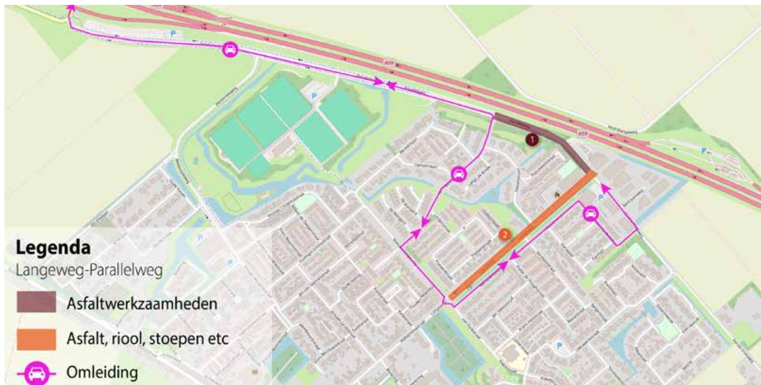
De aangegeven afsluitingen en omleiding

Op maandag 29 april start aannemer Van den Elshout en de Bont in opdracht van de gemeente Moerdijk met het onderhoud aan de Parallelweg en Langeweg in Fijnaart. In dit nieuwsbericht leest u meer over de werkzaamheden, planning en hinder voor verkeer.