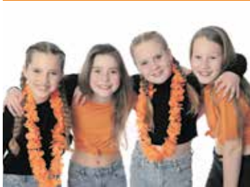
Zaterdag weer Koningsdag Pagina 5