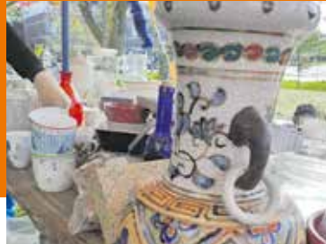
Bazaar/rommelmarkt Pagina 6