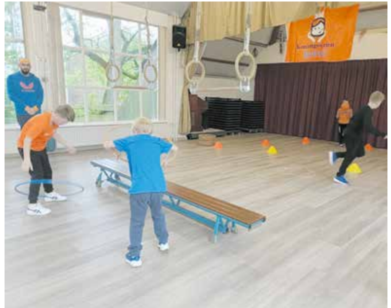
In groepjes werden de sport- en spelonderdelen uitgevoerd.

Al dat sporten en dansen kost natuurlijk de nodige energie, dus werd er in de pauze heerlijk gesmuld van een gezond tussendoortje. De ochtend werd afgesloten met een dansoptreden voor alle ouders in de aula van school. Nadat alle kinderen hun welverdiende medaille