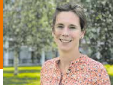
Bedrijveninterview Pagina 10