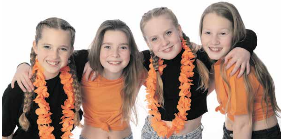
De danseressen openen dit jaar om 10.45 en 11.15 de runs van de oranjeloop. Om 12.00uur vind je ze samen met Koning Leeuw op het podium voor de minidisco.

Voor de jongere en creatieve inwoners van Fijnaart starten we om 09:45u wederom met de versierde fietsen die vanaf het Fendertshof onderweg gaan om de Voorstraat op te fleuren voor de aubade. Bij de aubade hopen we dit jaar weer een aantal gedecoreerden in het zonnetje te zetten voordat o.a. de Oranjeloop van start gaat met de wandeltocht en de kidsrun. Voor de liefhebbers van de fietstocht kan de route weer worden afgehaald bij de kassa vanaf 10:30u. Bij de Jumbo ligt de route voor de autotoertocht klaar voor de puzzelrit. Voor de jongste feestvierders is er van 10:30 tot 12:00 uur een Kinderochtend vol activiteiten. Van touwtje trekken tot schminken en een silent disco, er is genoeg te beleven voor de kleintjes. Tegelijkertijd kunnen avontuurlijke kids zich uitleven op de hindernisbaan