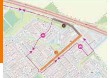
Onderhoud aan de wegen Pagina 13