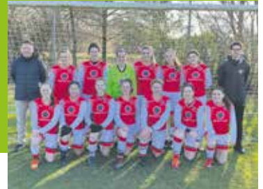
Dames 1 in de stijgende lijn