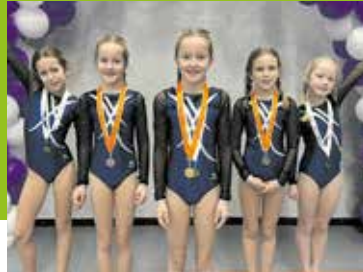
Regionale turnwedstijden komen er weer aan